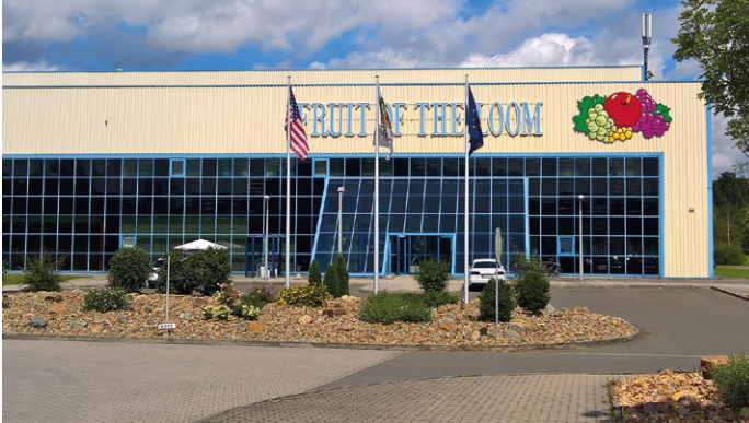
Die Europazentrale von Fruit of the Loom in Kaiserslautern

Diesen Monat feierte Fruit of the Loom International das 30-jährige Jubiläum des Standorts Kaiserslautern, europäische Zentrale der drei Marken Fruit of the Loom, Russell Europe und Jerzees. Hier werden die Textilien von mehr als 100 Mitarbeitern auf 84.000 Quadratmetern in